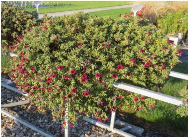
Aloha Kona Neon