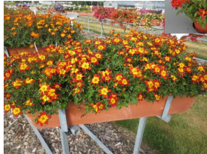
‘Campfire Fire Wheel‘