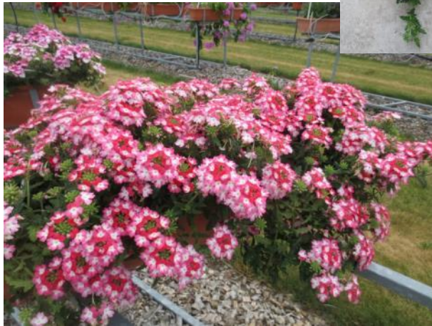
‘Oasis Up Hurricane Red‘