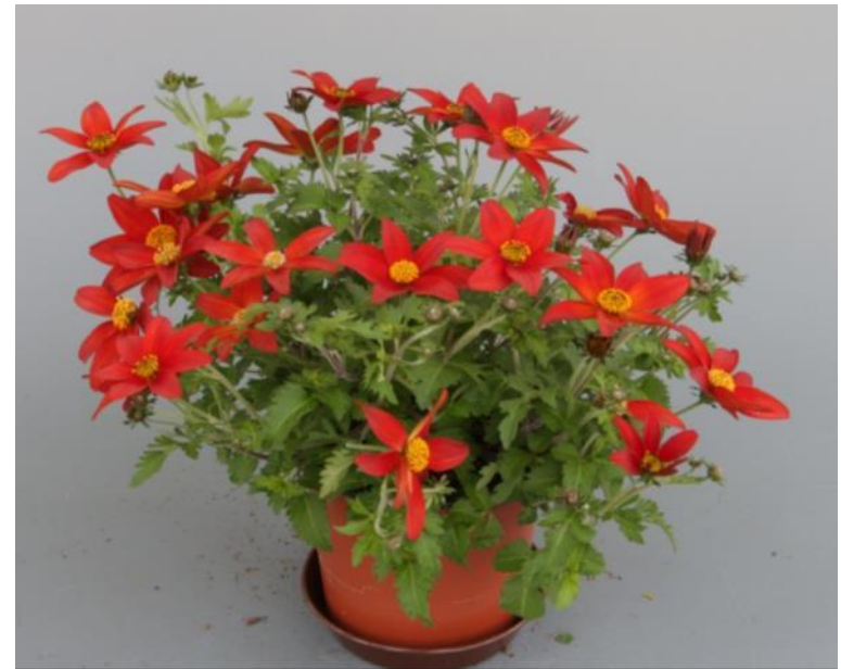
‘Campfire Fire Wheel‘