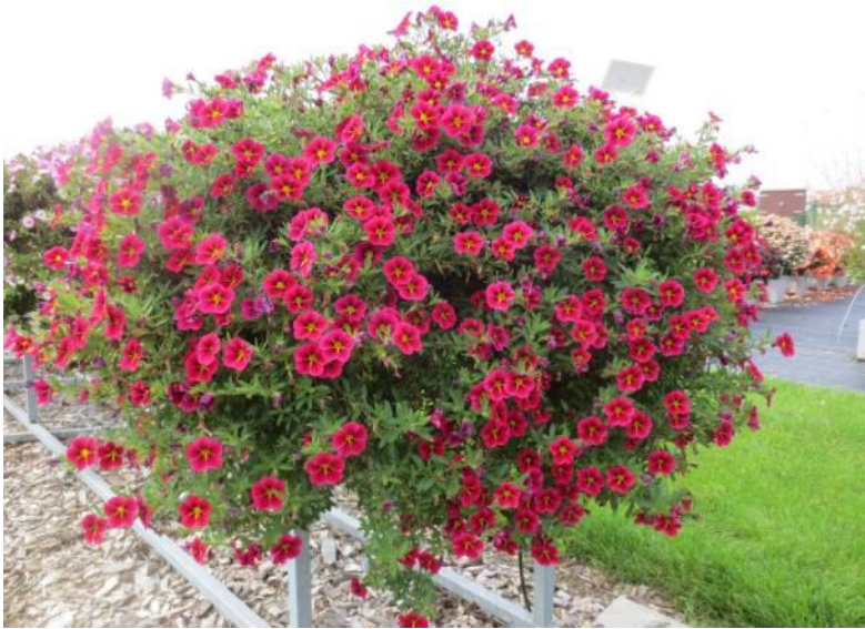
‘Calita Special Cherry Star‘