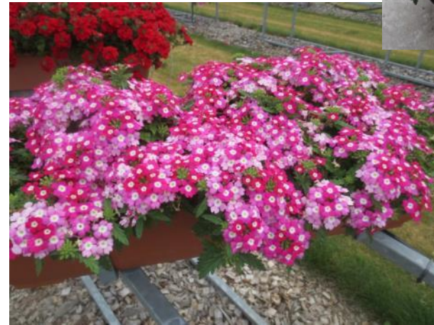
‘Lindolena Cherry Charme‘