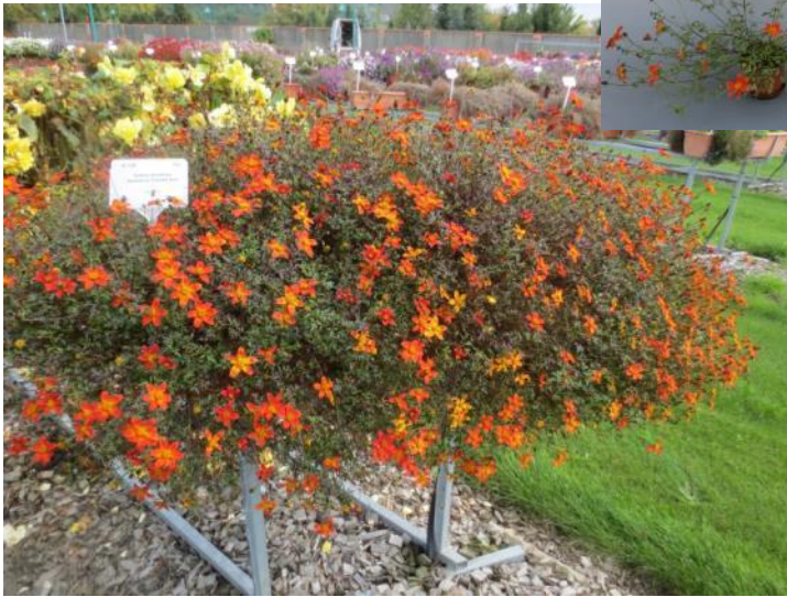
‘BeeDance Painted Red‘