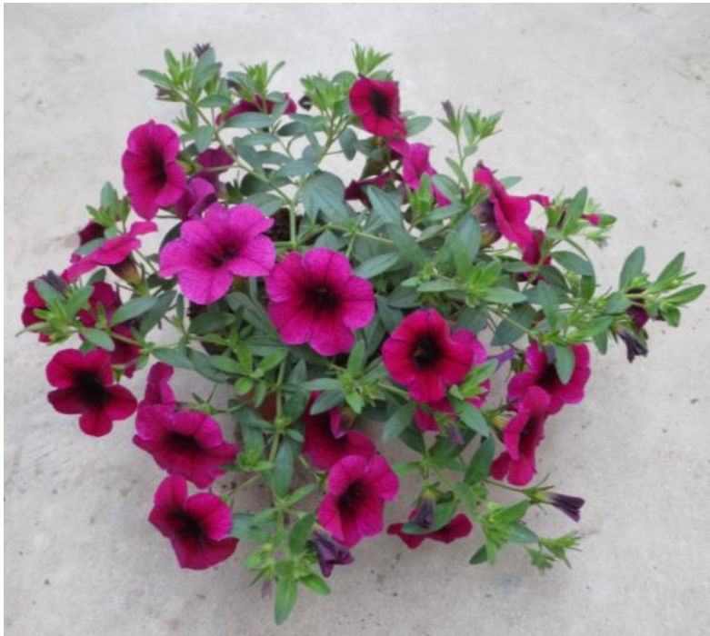
Aloha Kona Neon