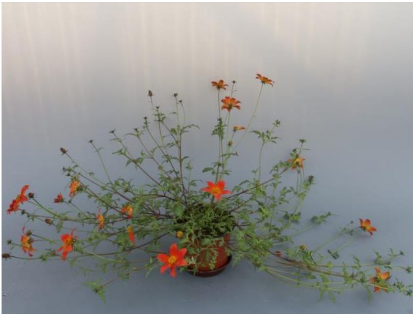
‘BeeDance Painted Red‘