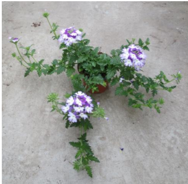
‘Oasis Up Hurricane Blue‘