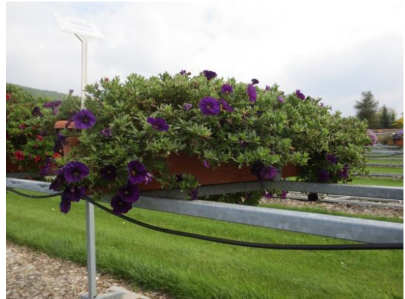
‘Aloha Nani Blue‘