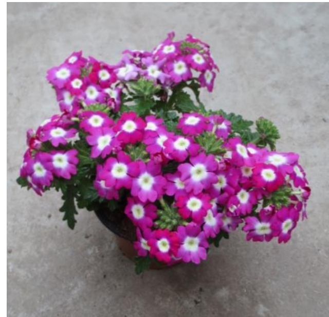
‘Lindolena Cherry Charme‘