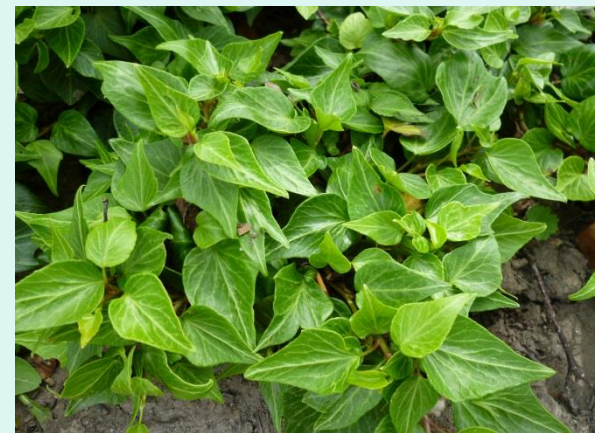
Hedera helix 'Tear Drops'