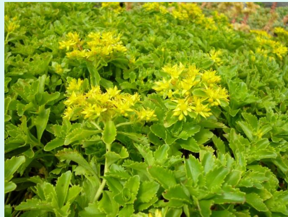
Sedum oreganum 'Selskianum'