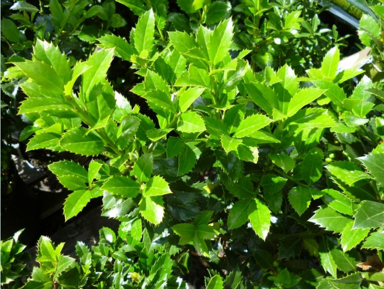
Ilex merserveae 'Heckenfee'