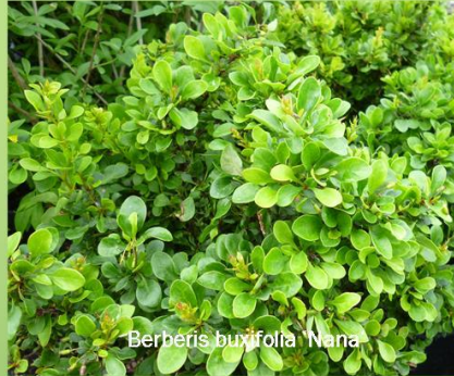
Berberis buxifolia 'Nana'

Euonymus fortunei var. radicans : schöne elliptische dunkelgrüne Blätter, halbschattiger bis schattiger Standort