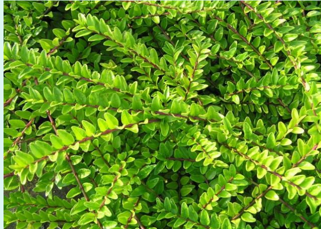
Lonicera nitida 'Maigrün'