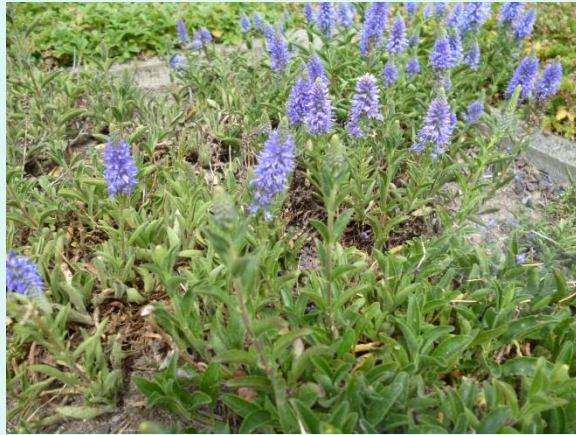
Veronica spicata 'Nana'