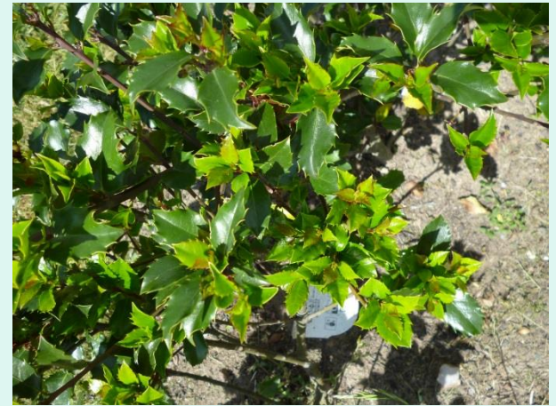
Ilex merseveae 'Blue Princess'

Koniferen am geeignetsten als Formgehölz