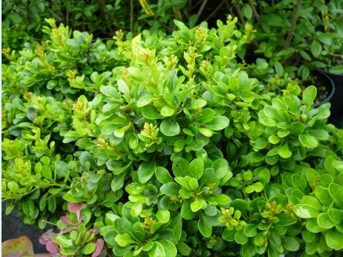
Berberis buxifolia 'Nana'