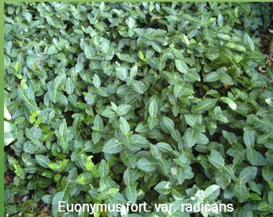
Euonymus fortunei var. radicans

Teucrium chamaedrys 'Nana': aufrechte kompakte Sorte, wintergrün, schöne altrosa Blütenstände im Sommer