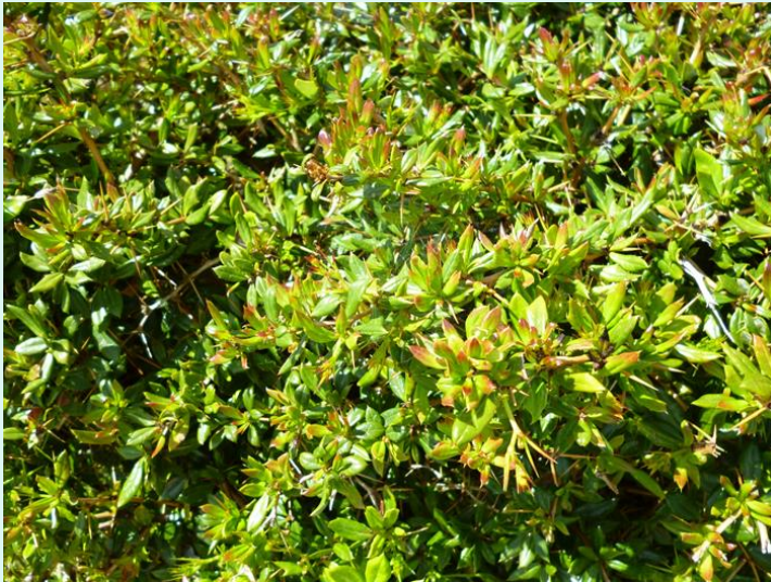
Berberis x fricardii 'Verrucandii'