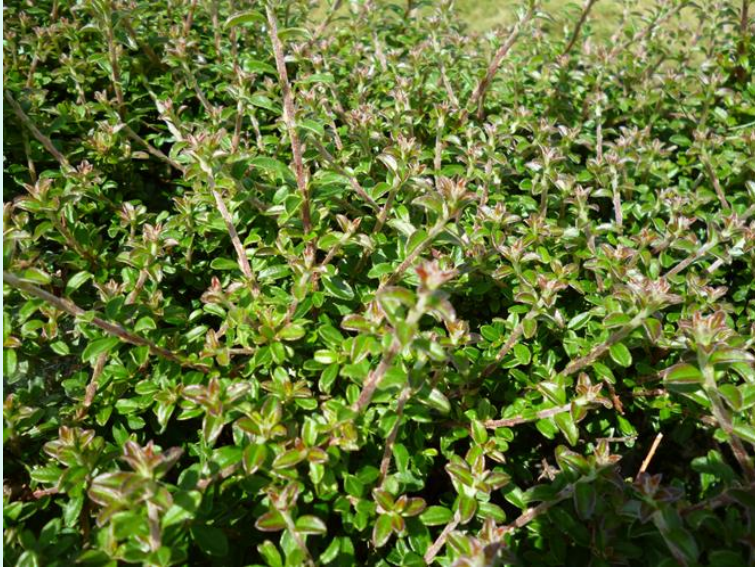
Cotoneaster conspicuus 'Decorus'

weniger schnittintensiv (1- 2 x im Jahr)