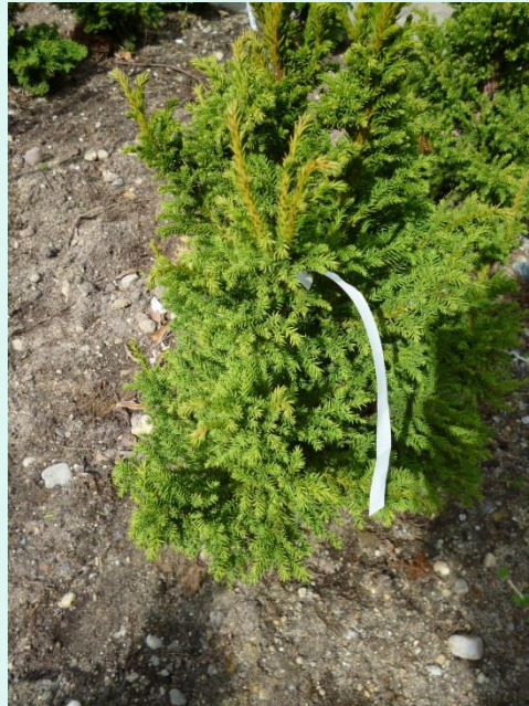
Cryptomeria japonica 'Bandai-sugi'