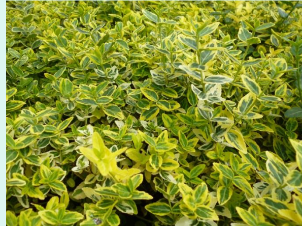
Euonymus fortunei 'Emerald'n Gold'