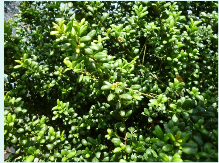
Ilex crenata 'Convexa'

häufiger Schnitt (2- 3 x im Jahr) empfehlenswert