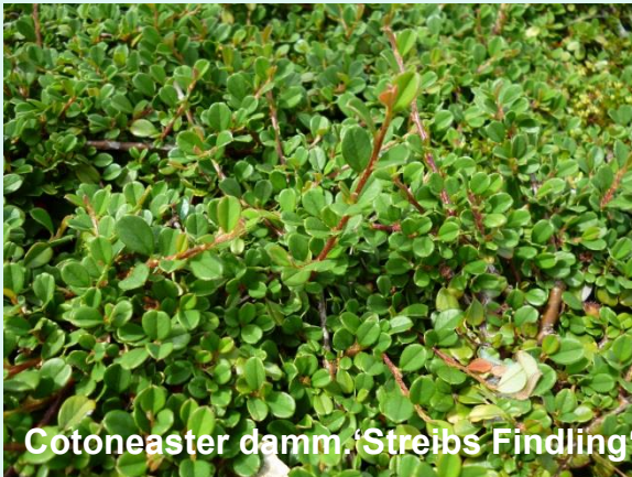
Cotoneaster damm. 'Streibs Findling'