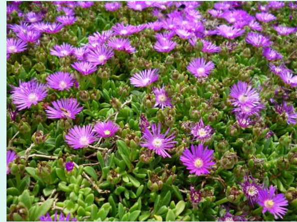
Delosperma 'John Profit'