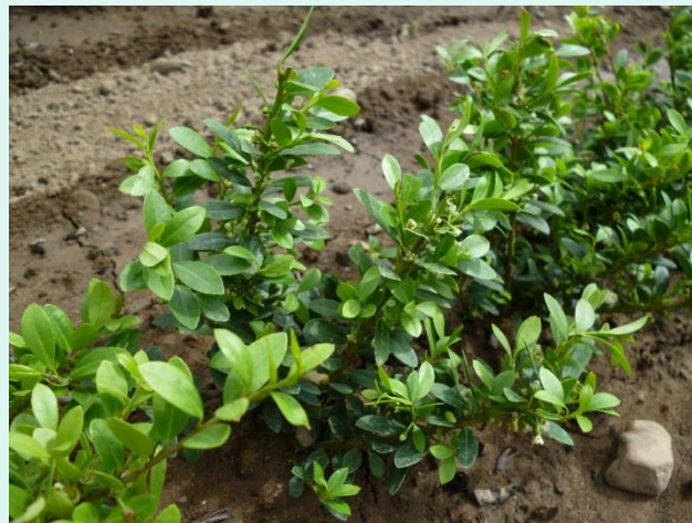
Ilex crenata 'Dark Green'