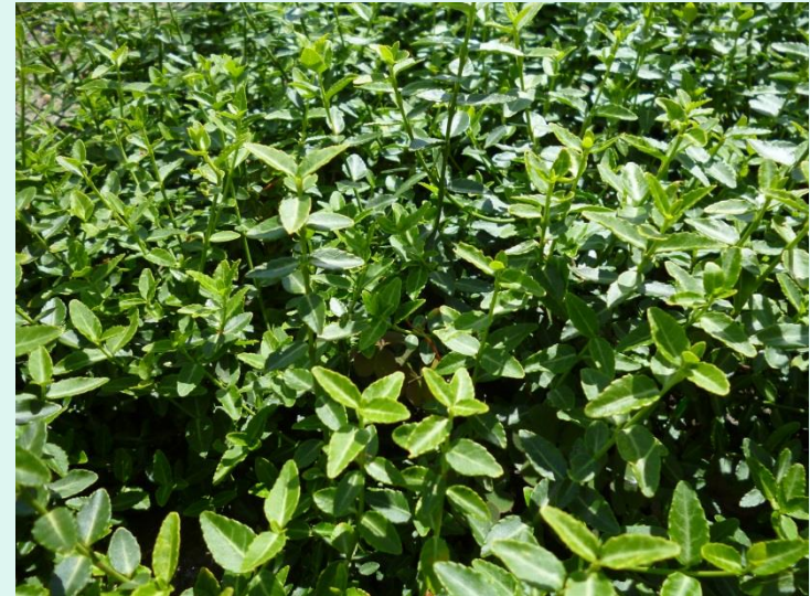
Euonymus fortunei var. radicans