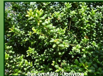
Ilex crenata 'Convexa'

Ilex crenata : aufrechter Wuchs, immergrüne kleine Blätter, lockeren frischen Boden, in der Jugend Winterschutz empfehlenswert