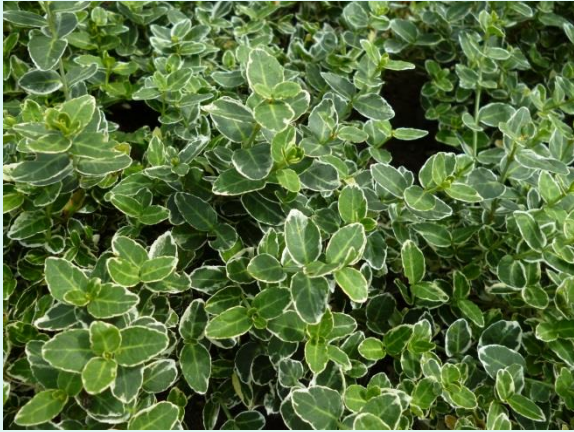
Euonymus fortunei 'Emerald Gaiety'