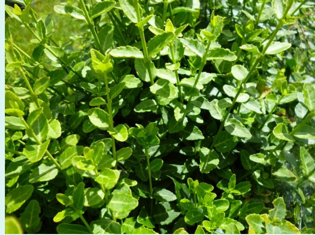
Euonymus fortunei var. radicans