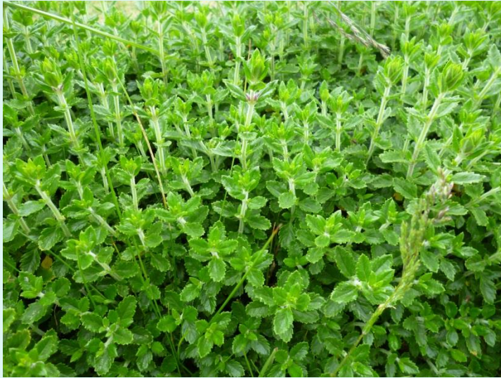
Teucrium chamaedrys 'Nana'