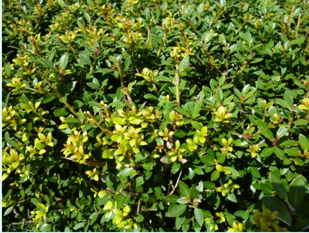
Ilex crenata 'Stokes'