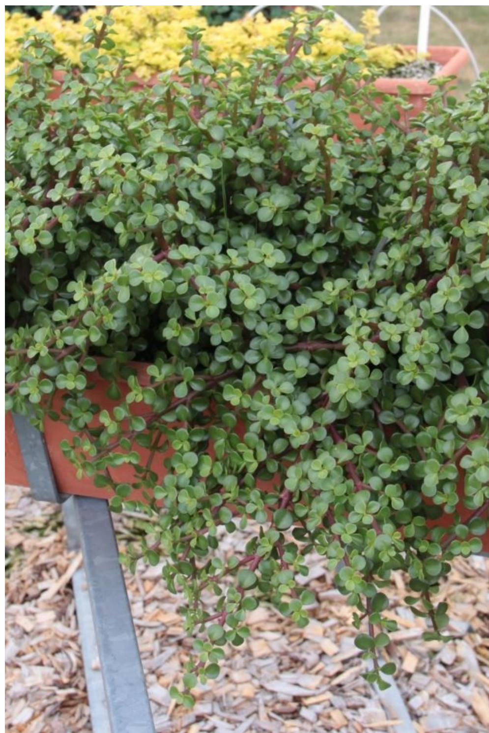
Opercularia 'Afra' (Psenner)