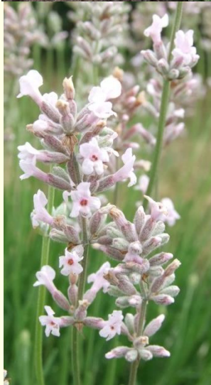
Lavandula angustifolia 'Jean Davis'