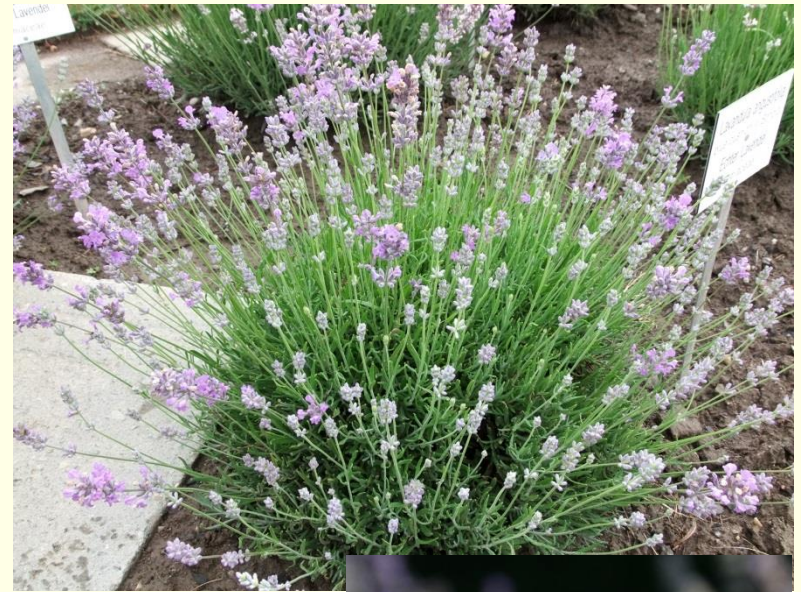
Lavandula angustifolia 'Blue Cushion'