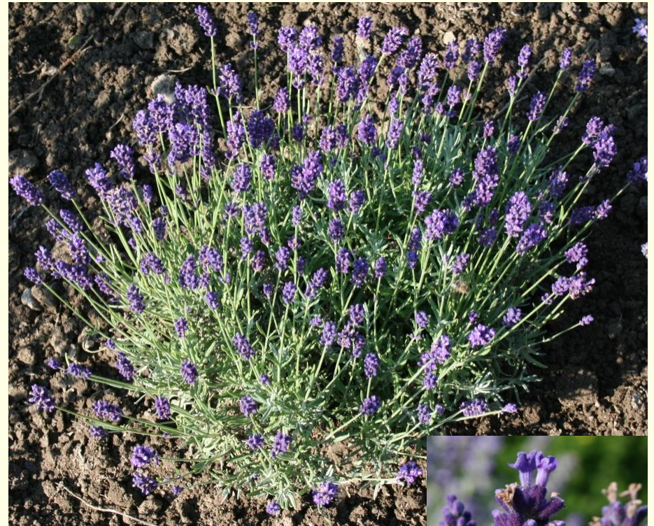
Lavandula angustifolia 'Blue River'