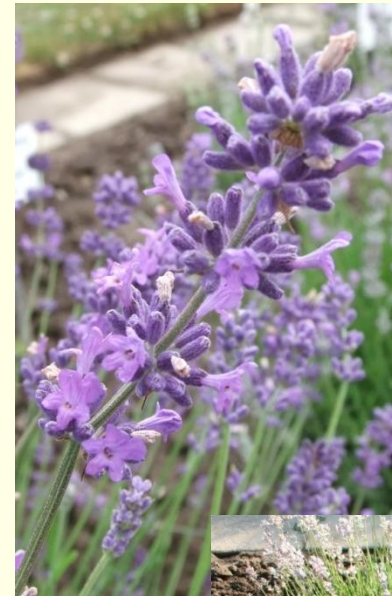
Lavandula angustifolia ‘Pacific Blue‘