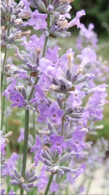
Lavandula angustifolia 'Twickle Purple'