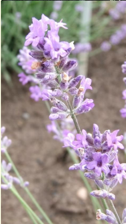
Lavandula angustifolia 'Folgate'