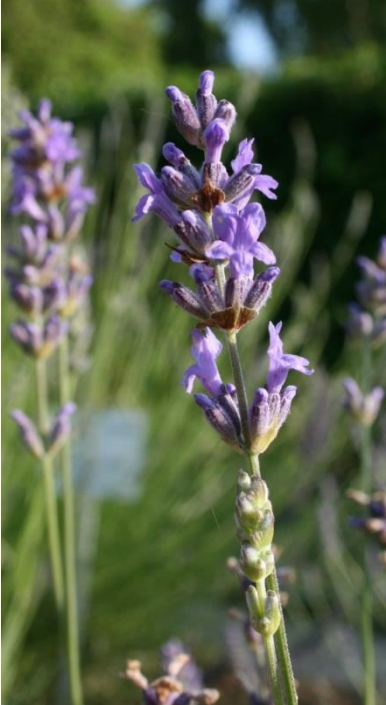
Lavandula angustifolia ‘Dwarf Blue‘