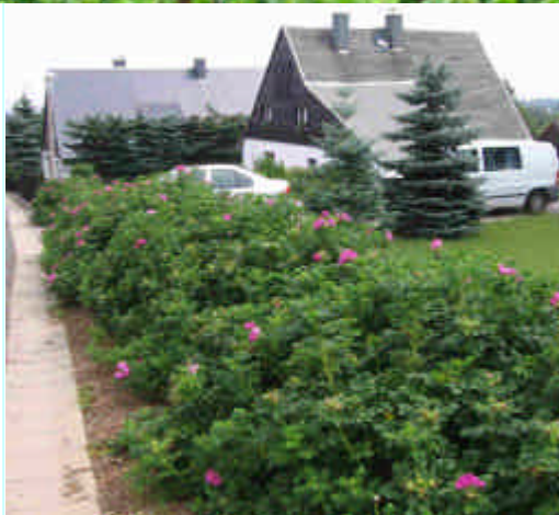
Freiwachsende Hecke Zinnwald/Erzg.