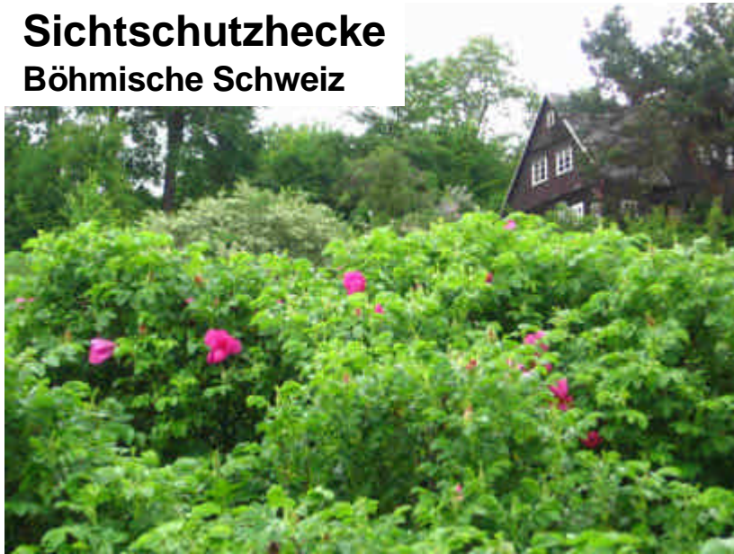
Sichtschutzhecke Böhmische Schweiz