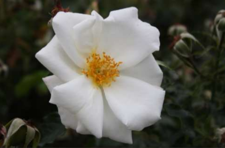
White Haze, Tantau 2005