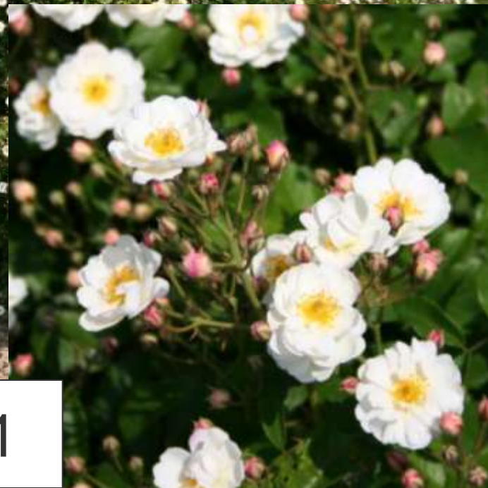
Dentelle de Bruges, Lens 1991