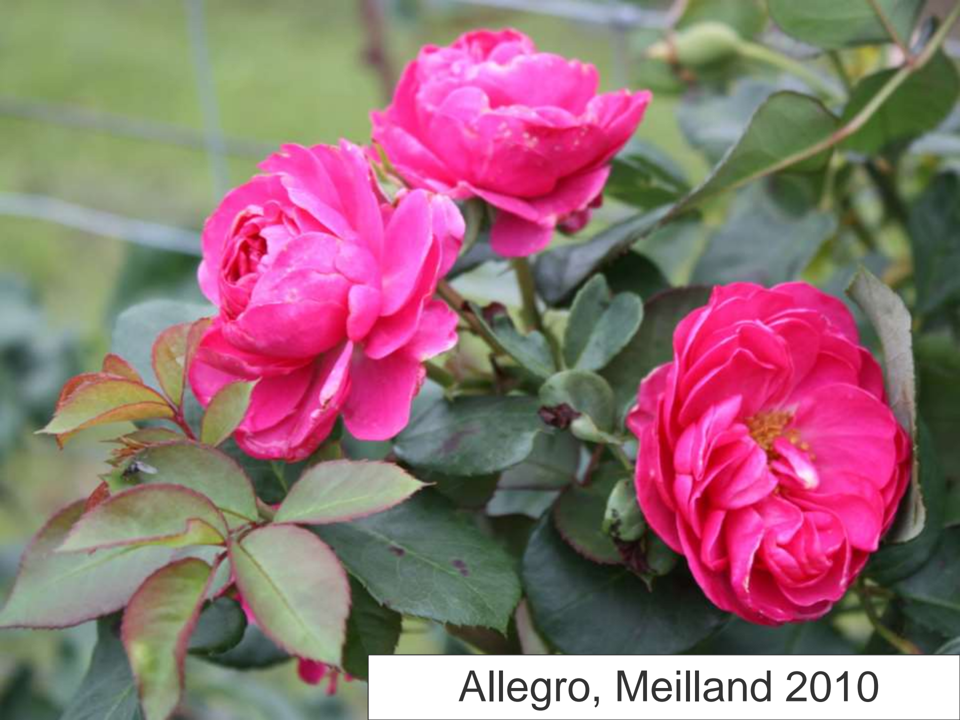
Allegro, Meilland 2010