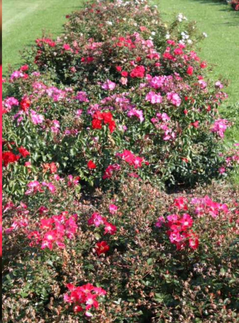
Candia Meidiland, Meilland 2007