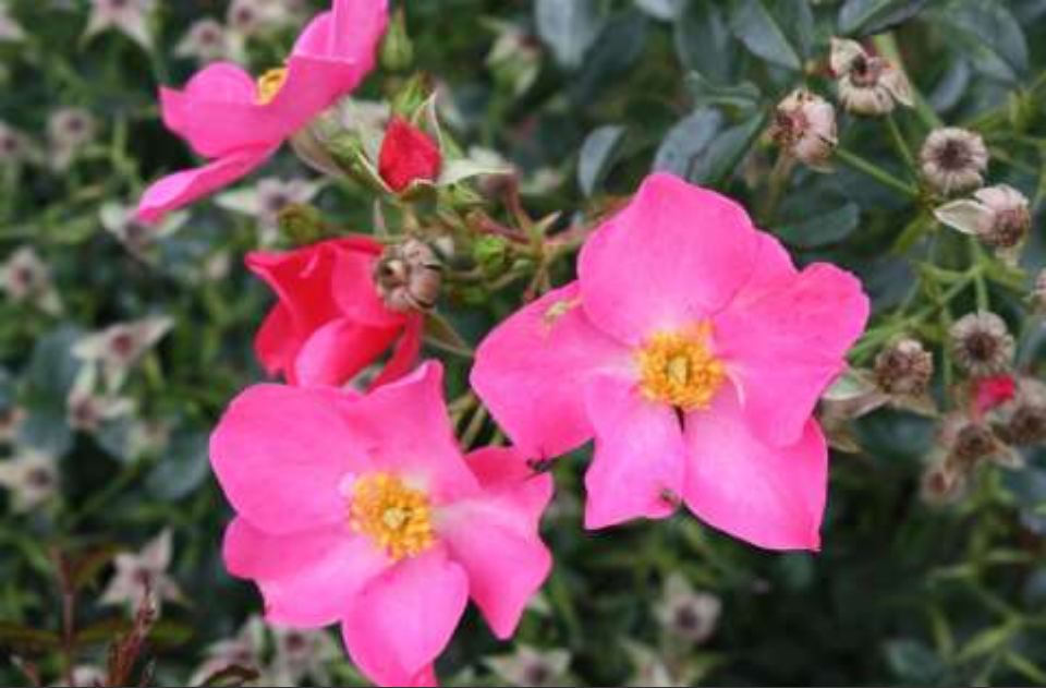
Ravenna, Noack 1999