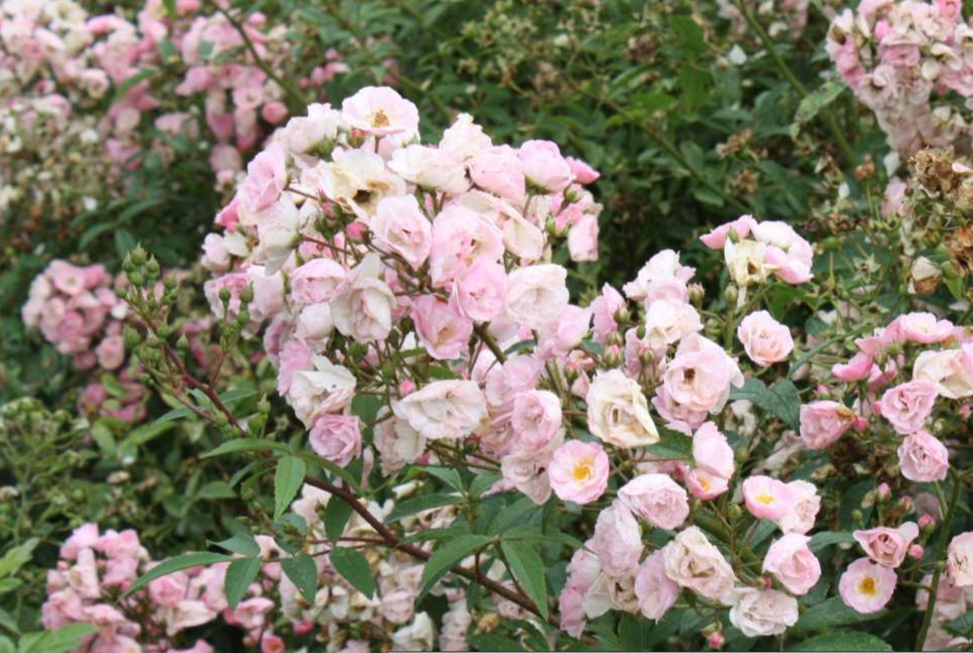
Heavenly Pink, Lens 1997