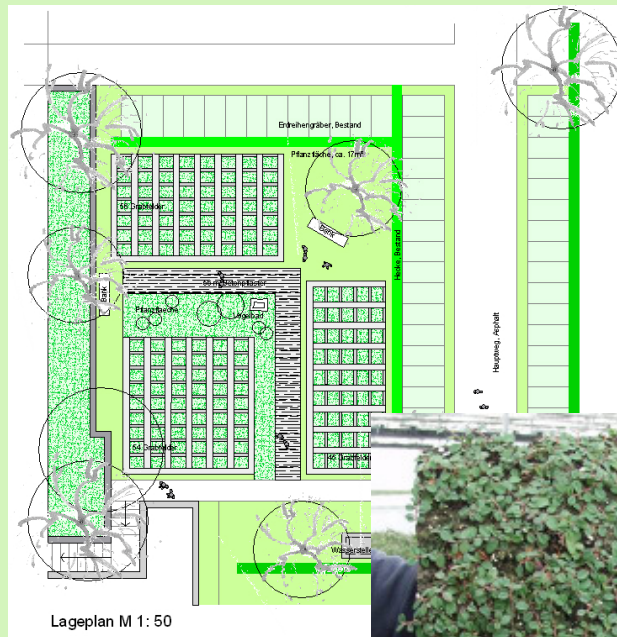
Lageplan M 1:50