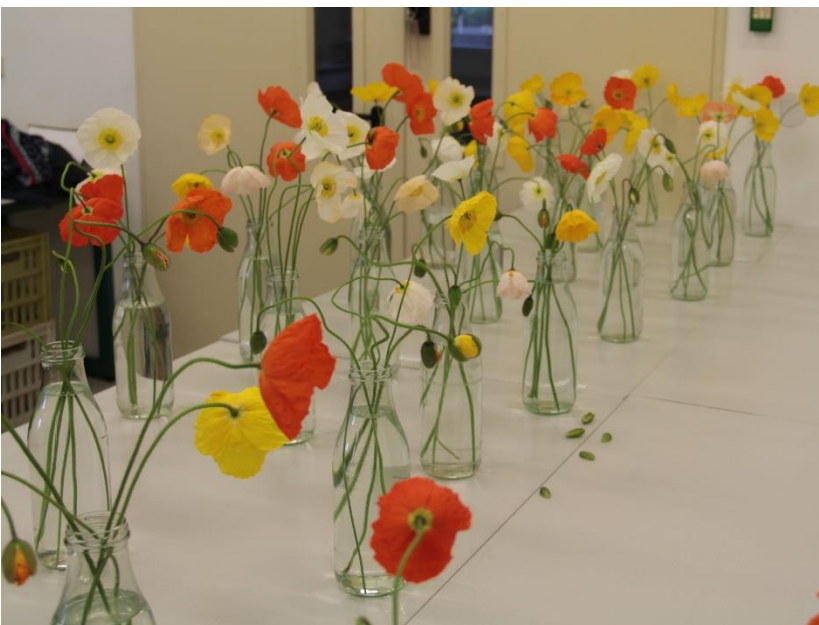
Abbildung 4: Papaver nudicaule im Haltbarkeitstest 2020, Foto: M. Dallmann, LfULG Dresden-Pillnitz