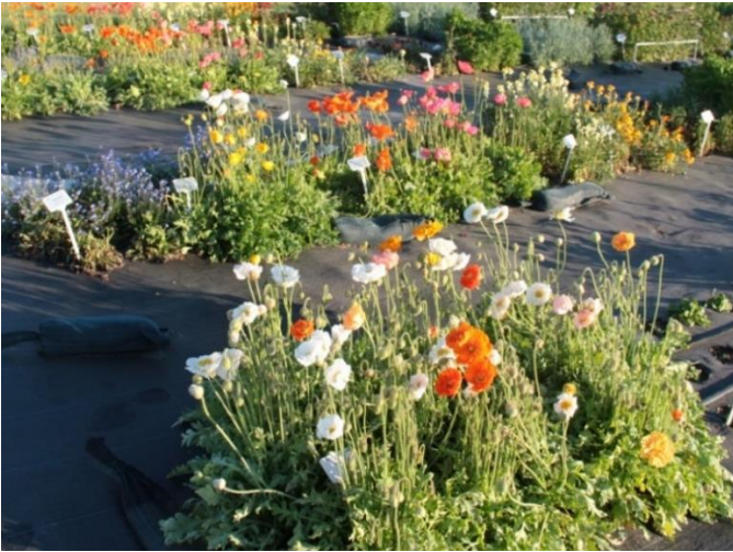
Abbildung 3: Blick auf einen Teil der Papaver nudicaule -Parzellen im Freiland in Woche 19/2018

Testung der Vasenhaltbarkeit bei 20 °C Soll-Temperatur, 60 % relativer Luftfeuchte und täglich 12 h Licht (700 bis 800 lx) in Leitungswasser und mit Zusatz von Chrysal Clear professional 3 (1%ig)